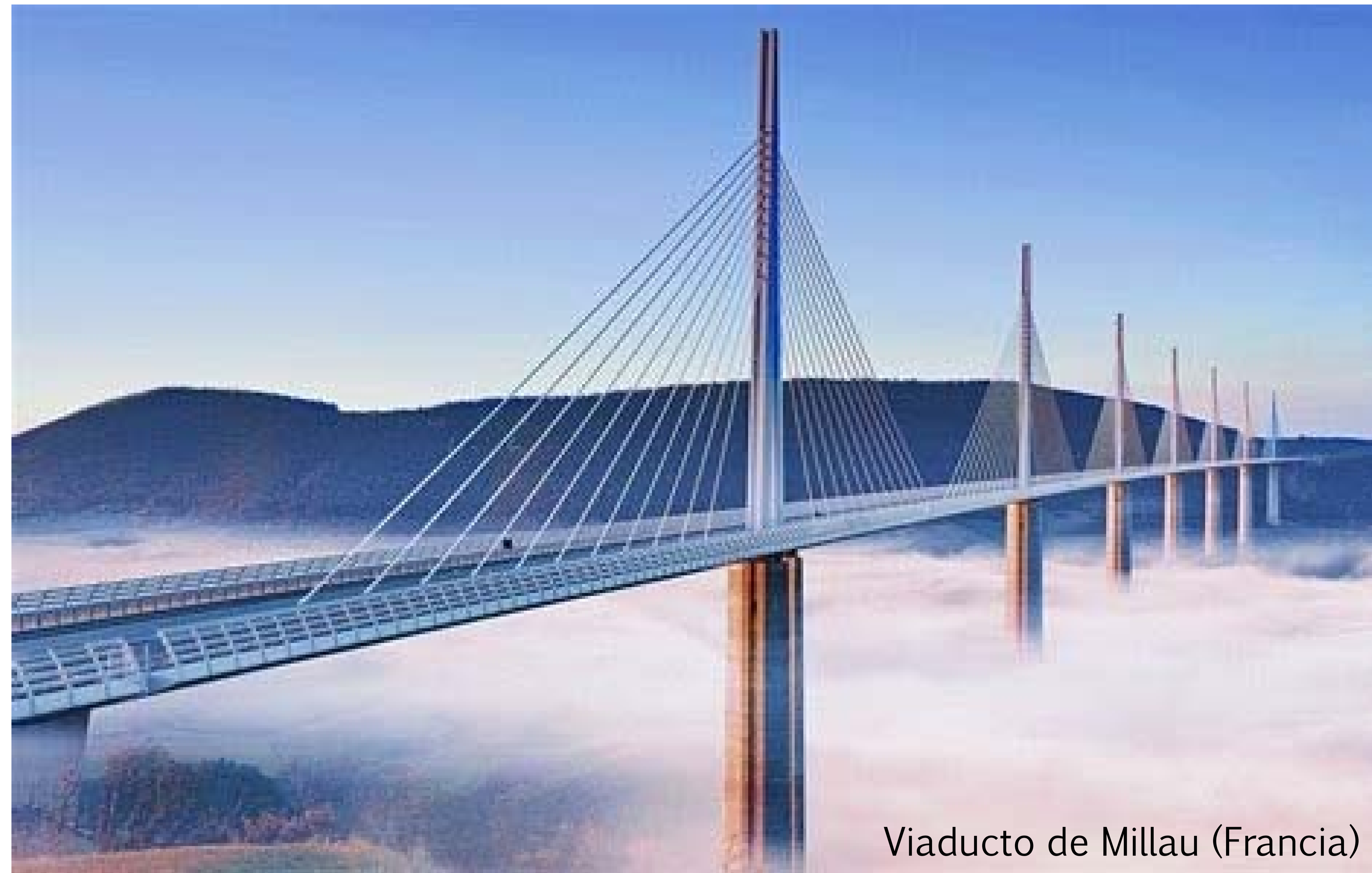
Viaducto de Millau (Francia)